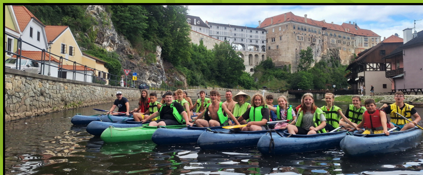
Vodácký tábor - Vltava 2024