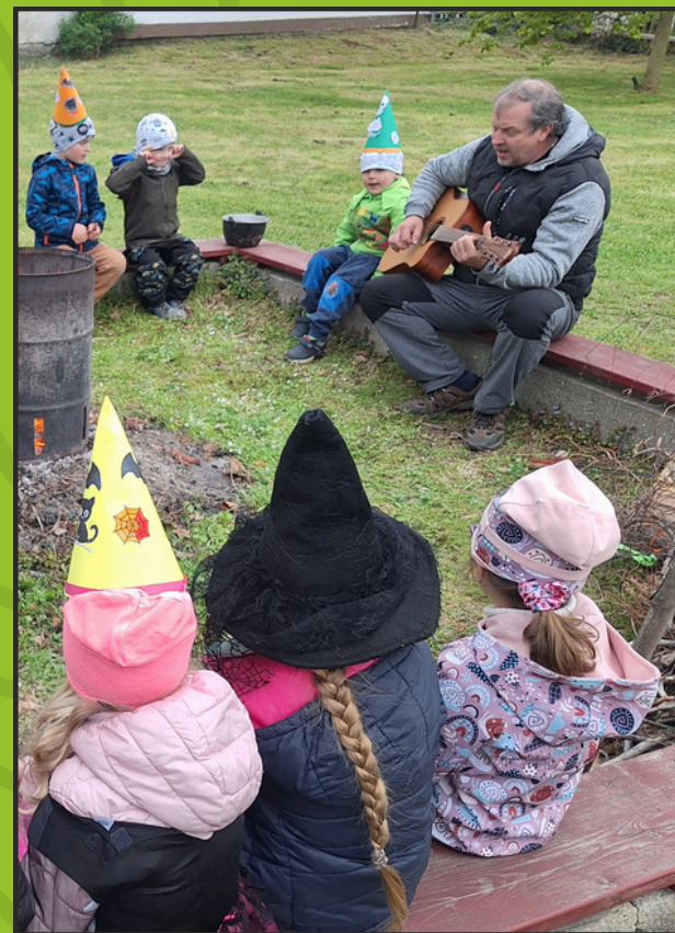
Improvizované propojení kroužků