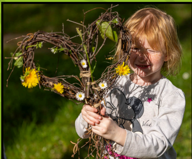
Jarní workshop 2024