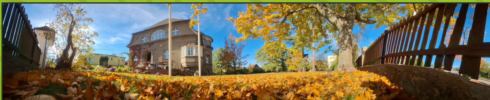
Hlavní budova se zahradou v Žitavské ulici během podzimu