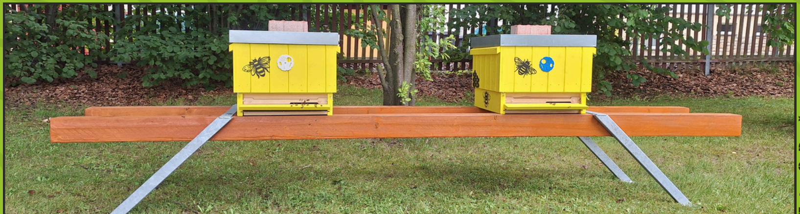
Nový kroužek Bee Happy jako highlight nových vzdělávacích kroužků pro šk. r. 24/25

Jsme stabilním poskytovatelem pestrého volnočasového vzdělávání pro Hrádek nad Nisou a přirozenou spádovou oblast okrajových částí s občasným přesahem i dál (Bílý Kostel n. N., Chrastava). Poptávka je dle našeho názoru u pomyslného kapacitního stropu. Potenciál vidíme ještě ve vzdělávacích kroužcích, které si ale jen obtížně vydobývají své místo, neboť tento druh vzdělávání je u nás nový a doposud neobjevený. Svou roli hraje i menší “akčnost”, která je účastníky a zejména rodiči často vyhledávána.