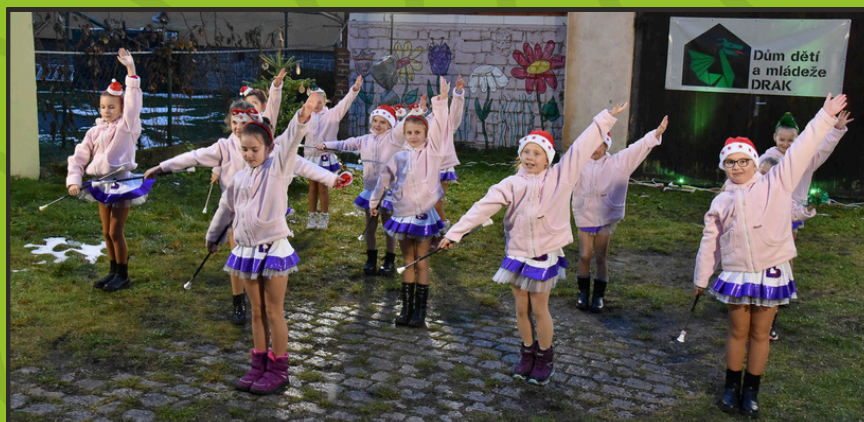
Hvězda pro Mikuláše 2023