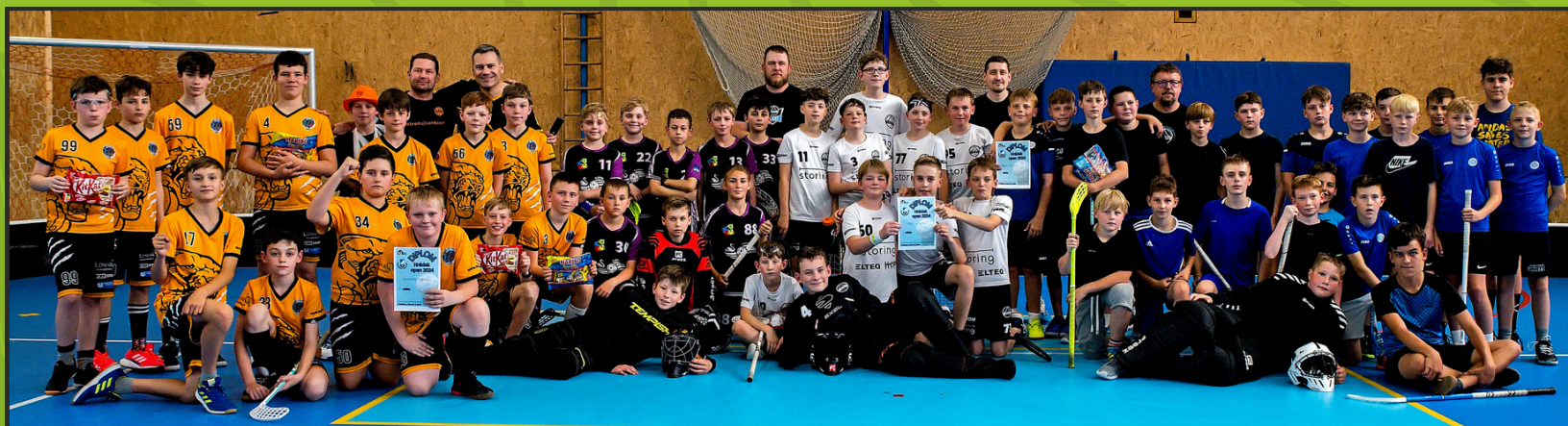
Florbalový tým uspořádal v červnu 2023 turnaj v Sokolovně