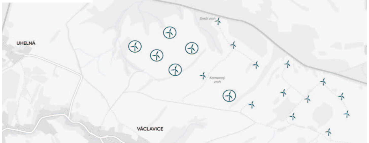
Návrhy rozšířeného větrného parku o 3 věže s výkonem 4 MW nebo o 6 věží s výkonem 2 MW.